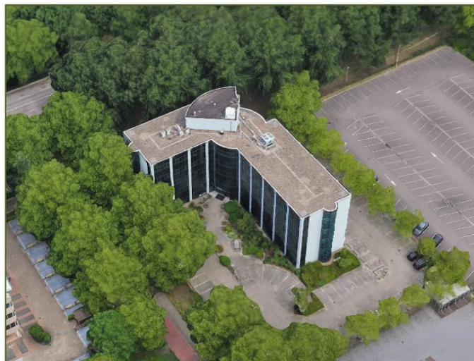
Figuur 1: Diemerhof 2