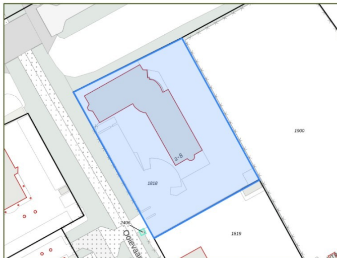
Figuur 2: Perceel Diemerhof 2